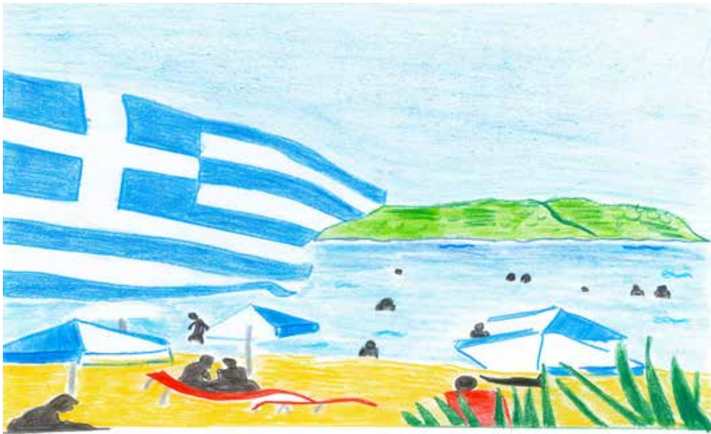
καλοκαίρι στην Ελλάδα