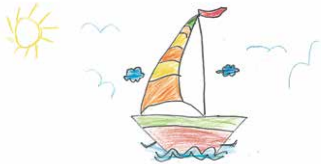
καλοκαίρι στην Ελλάδα!!